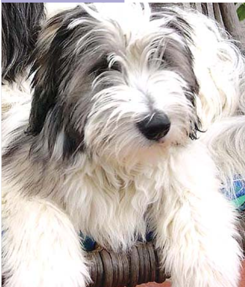
Da kann Sammy noch so lieb schauen: Die Knochen der Weihnachtsgans sind für ihn tabu.

Häufig wollen Kinder Tiere mit Süßigkeiten verwöhnen. Abgesehen von Übelkeit, Erbrechen und Durchfall kann eine Vergiftung die Folge sein. Schokolade enthält „Theobromin“, das für Haustiere giftig ist. Eine Dosis von 100 bis 200 Milligramm ist für einen mittelgroßen Hund tödlich. Eine Tafel Vollmilch-Schokolade enthält zirka 150 bis 230 Milligramm dieses Stoffes.