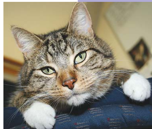
Kater Elvis ist ungern der Verlierer.