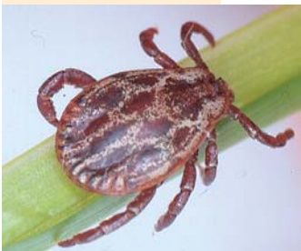
Die Dermacentor- Zecke

Viele Tierhalter wissen, dass im Ausland gefährliche Krankheiten über Zecken, Mücken und Flöhe übertragen werden können. Nur wenige sind sich aber bewusst, dass diese Gefahr für Hunde und Katzen auch hier in Deutschland besteht.