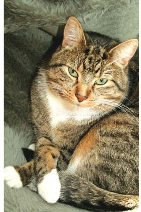
Kater Elvis: eine Woche im Ausnahmezustand

Doch das Schlimmste waren nicht die fehlenden Extra-Happen. Oft bin ich abends mit Herrchen verabredet – zu einem konspirativen Treffen sozusagen. Dann schlemmen wir noch ein wenig: kaltes Hähnchen, Pute, manchmal sogar ein kleines Steak. Da unsere kulinarischen Zusammentreffen ausblieben, knurrte mir doch tatsächlich abends extrem der Magen! „Hast du mich vermisst?“, säuselte Herrchen, als es zurückkam. Als Antwort entfuhr mir nur ein kräftiges „Miau“. Eigentlich wollte ich sagen: „Was denkst du denn, Kumpel? Ich bin schon fast verhungert! Lass uns endlich zum Kühlschrank gehen, damit ich mal wieder was Vernünftiges zu essen bekomme. . .