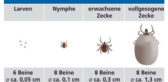
Abbildung 2, www.bayer.de