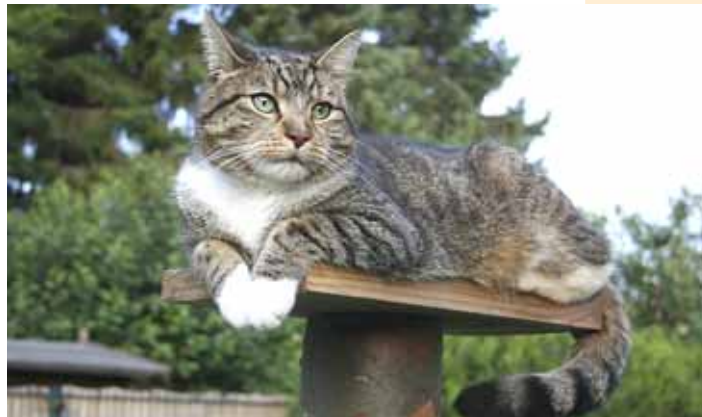
Kater Elvis vermisst die Mäuse.

Es ist wie verhext: seit Tagen habe ich keine einzige Maus gefangen! Okay, mein Revier beschränkt sich zwar nur auf unseren Garten, aber in den vergangenen Monaten hat sich regelmäßig ein kleines dummes Nagetier im Garten verirrt. Doch jetzt ist kein einziges weit und breit zu sehen! Sollten die winzigen Gesellen dazu gelernt haben? Sind sie intelligenter geworden oder haben sie sich gar abgesprochen? Ich weiß es nicht.