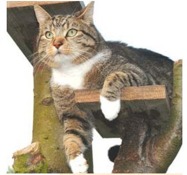
Kater Elvis im Jagdfieber

Es dämmt. Die Nacht kündigt sich an. Noch etwas schlaftrunken springe ich vom Regal. Die Jagdsaison ist eröffnet.